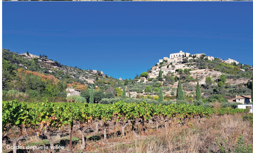
Gordes depuis la vallée