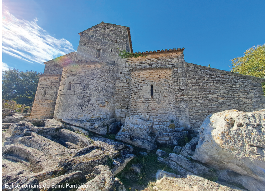
Eglise romane de Saint Pantaléon

Aux confins du Parc Naturel Régional du Luberon, au cœur des monts de Vaucluse, Gordes est l'emblème du village perché provençal. Alors que le XVIII e siècle marque l'apogée économique de Gordes autour du commerce de l'huile d'olive, de la sériciculture et de l'artisanat du cuir, l'exode rural du XIX e siècle puis les destructions de la seconde guerre mondiale provoquent son déclin. Le village doit son renouveau au coup de cœur d'André Lhote en 1940. Le peintre et écrivain s'implique dans la renaissance du village et entraîne dans son sillage de nombreux artistes et intellectuels.